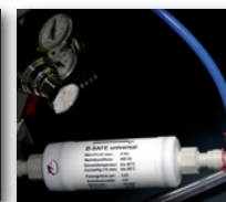
UltraFiltrierung 0,02 µ

Zur Verbesserung der Wasserqualität, insbesondere der Verhinderung von Verkeimungen empfehlen wir Ihnen unbedingt den Einsatz von Filtersystemen. Wir bieten Ihnen verschiedene Möglichkeiten, beispielsweise: